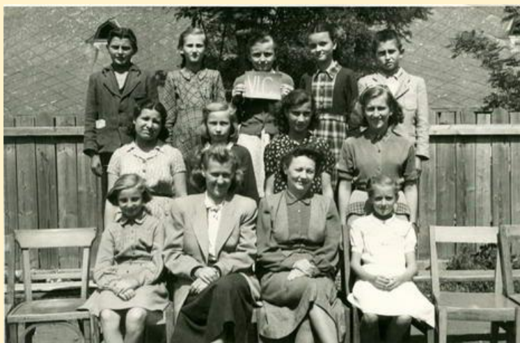
Leányiskola a Kossuth úton 1952-53-ban

1950. február 20-i kérdéssor megállapításai szerint 5.058 m 3 a beépített terület, 2.141 m 2 az épülethez tartozó telek, 707 m 2 a világított alapterület és 1.910 m 3 a fűtött tér.